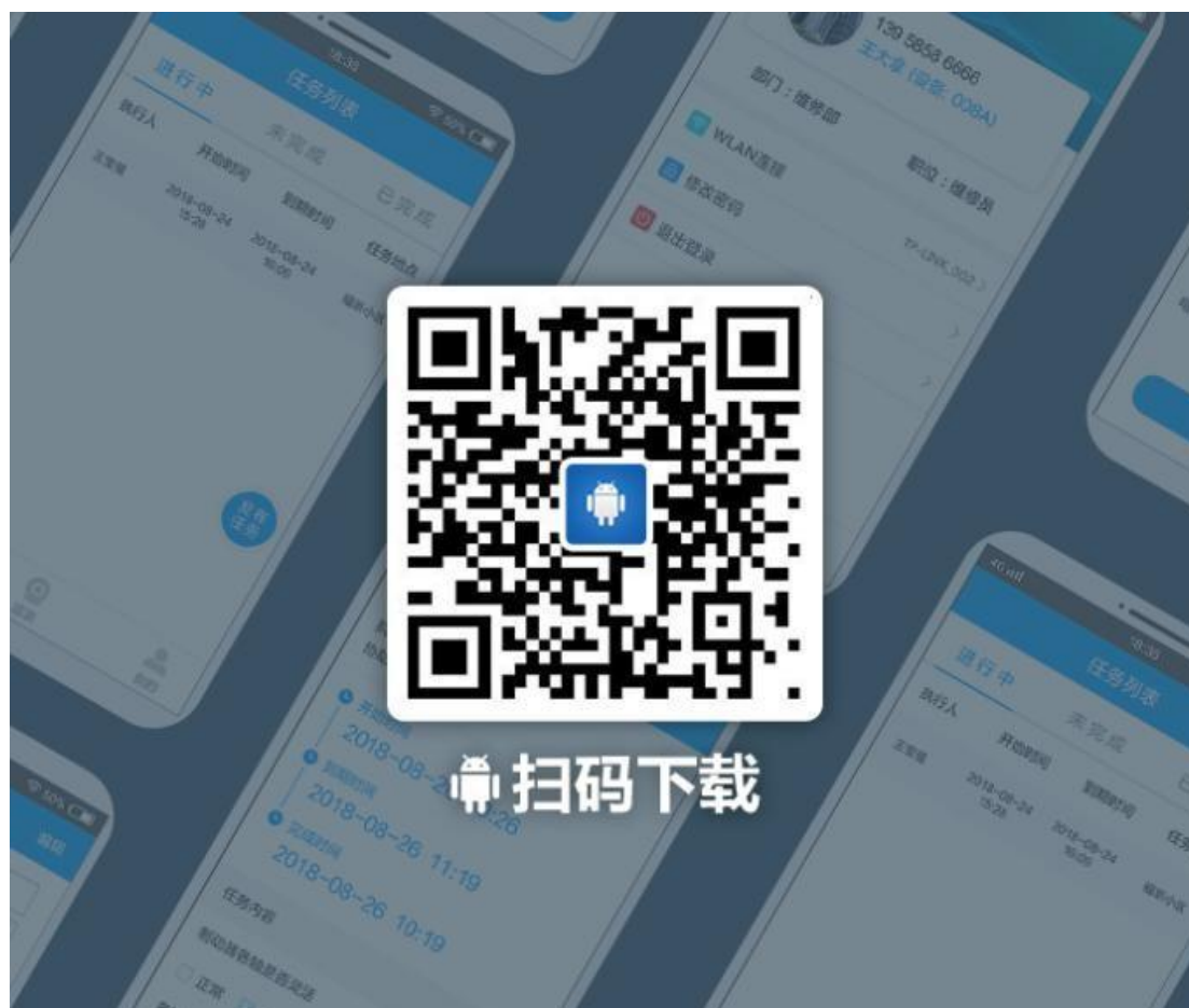
安卓个人版APP 下载二维码