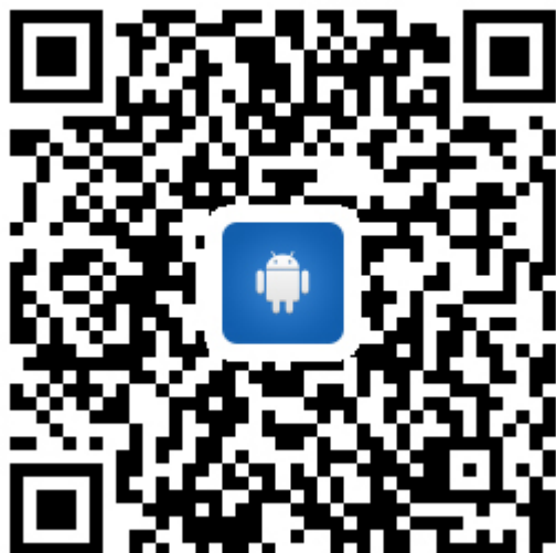
安卓个人版 APP 下载二维码